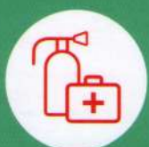
Огнетушитель и аптечка