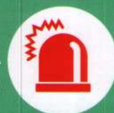
Маячок желтого цвета