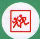
Опознавательные знаки «Перевозка детей»