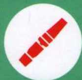
Штатные ремни безопасности