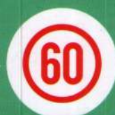
Опознавательный знак «Ограничение скорости»